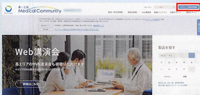
▲サイトのWeb講演会トップページ